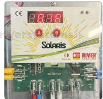
Auf dem Display

Verbindet die SOLARIS®- Steuereinheit mit dem Inkubator.