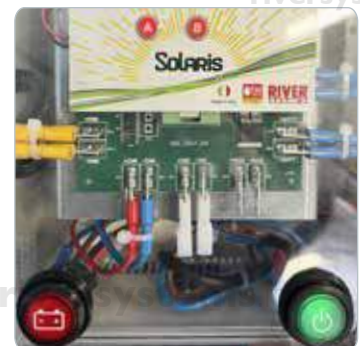
Grüner und roter Schalter

Ermöglicht die Kühlung des Steuergeräts während des Betriebs.