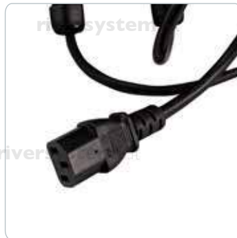
Inkubator-Stromversorgung 24 VDC

Verbindet die SOLARIS®- Steuereinheit mit dem Inkubator.