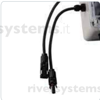
Anschlüsse für Solarmodule